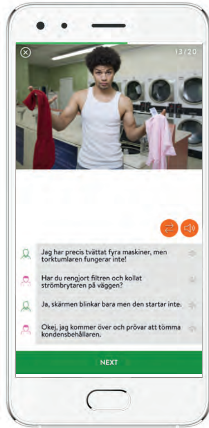
Diyalog – konuşmayı dinleyin.